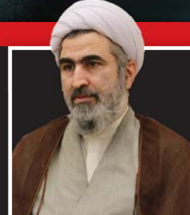
حجت الاسلام مقیمی حاجی