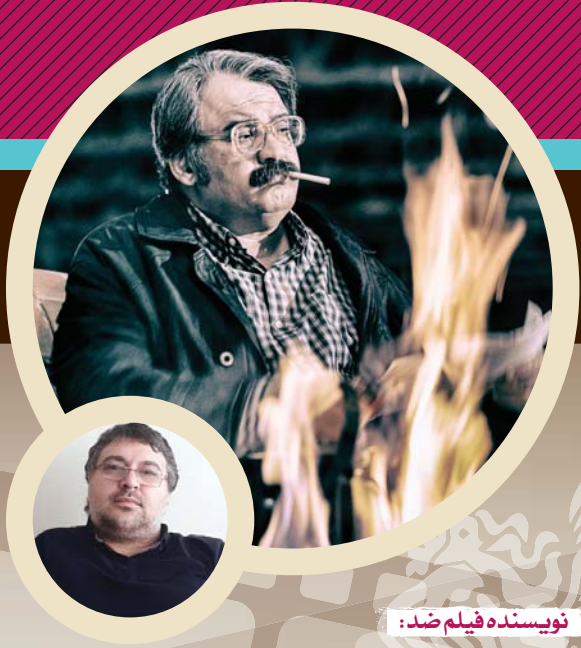
نویسنده فیلم ضد:

سازمان سینمایی حوزه هنری در چهلمین جشنواره فیلم فجر با موضوعات مختلفی همچون اجتماعی، حادثه‌ای و درام حضور پررنگی دارد. فیلم‌هایی که بیشتر یک اتفاق یا ایده شده تا نویسندگان آنها تصمیم به نگارش فیلمنامه این فیلم‌ها بگیرند. راهیابی چهار فیلم حوزه هنری به جشنواره فیلم فجر امسال بهانه‌ای شد تا سراغ نویسندگان فیلم‌های هناس و ضد برویم تا برایمان از چند و چون کارشان بگویند. همچنین پای صحبت رضا رویگری بازیگر پیشکسوت فیلم شادروان نشستیم تا خاطراتش از بازی در فیلم‌ها را با ما مرور کند.