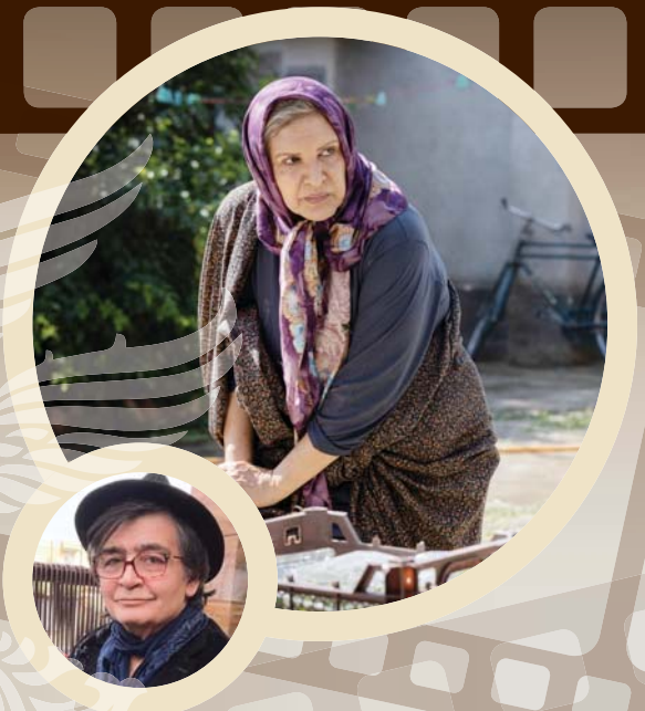
رضا رویگری بازیگر فیلم شادروان: