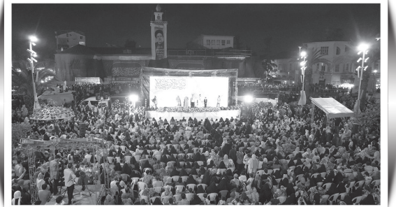
جمعیت ۲۰ هزار نفری مردم در جشن محفلی‌ها؛ میدان شهرداری رشت