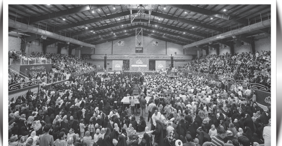
استقبال ۱۰ هزار نفری از عوامل برنامه محفل؛ شهر الوند استان قزوین

بعد از پخش فصل دوم برنامه تلویزیونی محفل در شب‌های ماه رمضان، داوران و مجری این برنامه بیش از پیش در بین مردم حضور می‌یابند. یکی از جلوه‌های برجسته این حضور مردمی، برنامه‌هایی است که به درخواست استان‌های مختلف در کشور برگزار می‌کنند و چند ساعتی را به تلاوت قرآن، اجرای سرود، تواشیح و... می‌پردازند و سعی می‌کنند لحظه‌های زندگی مردم را با قرآن پیوند بزنند.