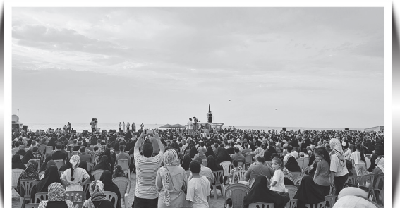
حضور پرشکوه مردم در برنامه محفلی‌ها؛ پارکینگ صفر ساحلی بابلسر