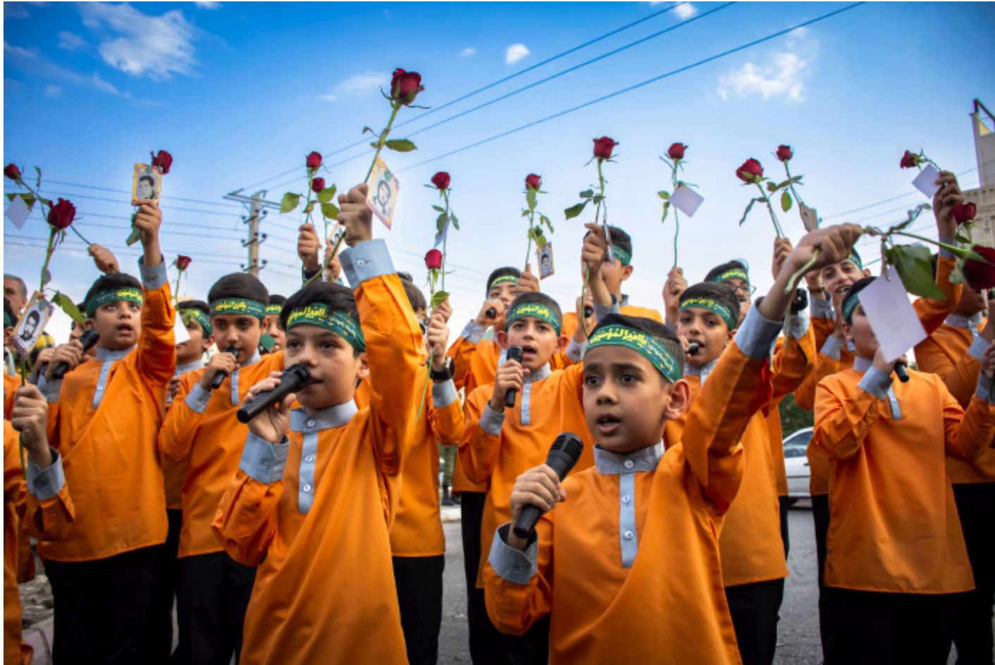
📷 علی ایک | سمنان برویچه‌های سمنان تنها گروه‌های نوجوانی نبودند که در غدیر گل به دست به خیابان آمدند و نغمه شادی سرودند.