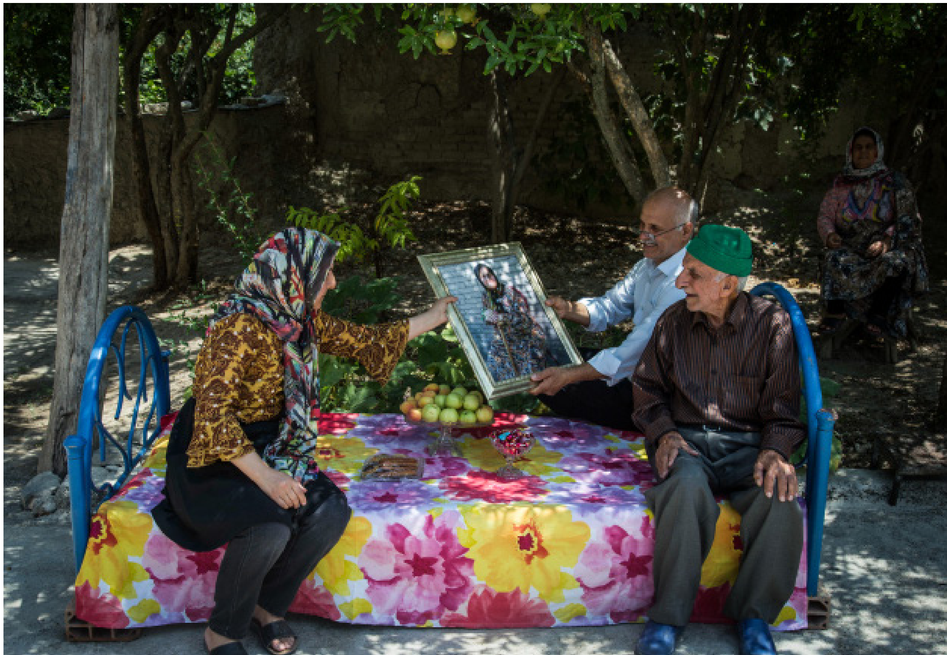
راجله حصاری | مجموعه عکس | گلستان سه طایفه اینچا ساکنند، همه سادات. پس باید هم عید غدیر رنگ و بوی متفاوتی داشته باشد. اینچا روستای کلاجان است. روستای سادات در استان گلستان.