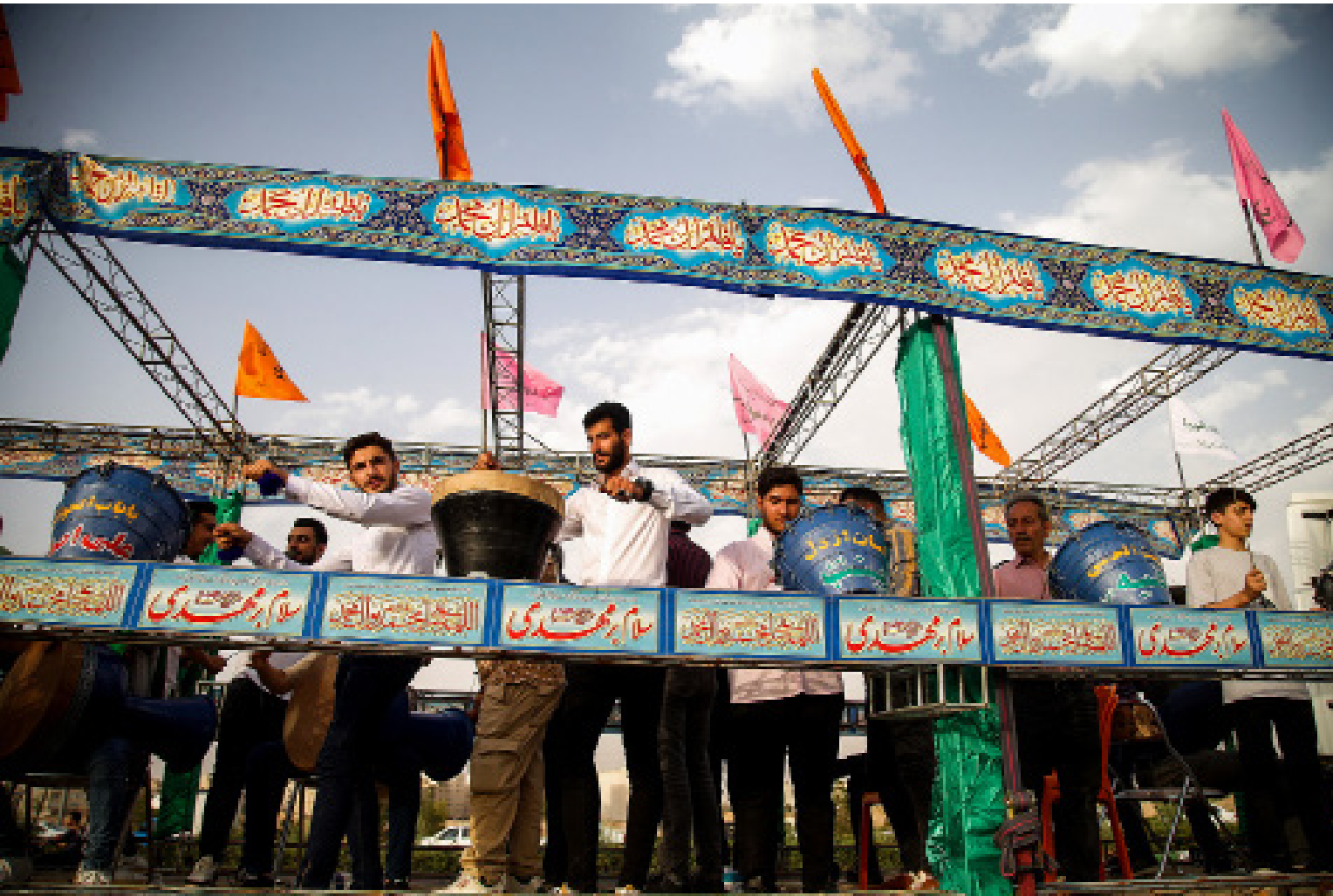
📷 حمید عابدی | قم

زیرسایه نام مرتضی علی علیه السلام؛ سلام بر مهدی صاحب الزمان (عج) می‌دهیم.